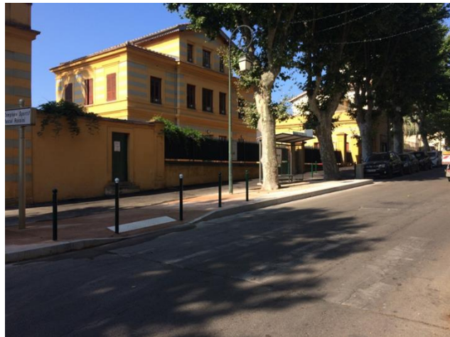
Le Cours Grandval