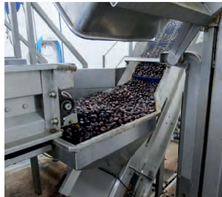
La production de crème de châtaignes

Aujourd'hui, on manque de foncier. On aurait pu s'installer sur la plaine orientale, mais ce n'est pas notre but. Notre entreprise est une entreprise du Pays Ajaccien avec des salariés et des familles qui habitent sur ce territoire. Notre souhait est de trouver du foncier pour continuer à faire grandir l'entreprise, et à la développer en restant sur le territoire de la CAPA.