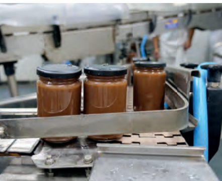
La crème de châtaignes

Corsica Gastronomía emploie une quarantaine de salariés et comme tous les ans, un petit groupe d'alternants. Cette année, ils sont sept dans divers métiers et dans divers services. Au sein de l'entreprise, on a la chance d'avoir une ossature solide de collaborateurs qui ont plus de 15 ans d'ancienneté, soit les deux tiers du personnel. C'est énorme, néanmoins on est en recherche de sang neuf et pour cela, on est en perpétuel recrutement. Des métiers sont en tension