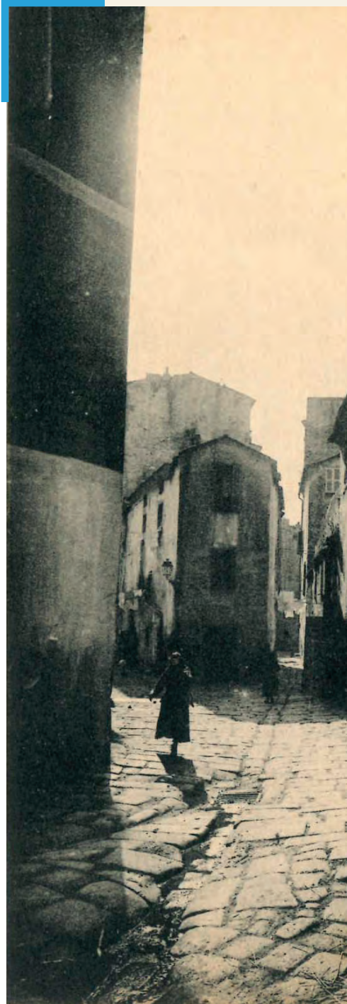
La vieille ville d'Ajaccio

Pas encore métropole mais de plus en plus attractive, Ajaccio séduit. Néanmoins à grandir trop vite, on oublie que rien ne sert de courir. Ralentir, prendre le temps, réparer, apaiser pour répondre aux attentes des habitants, telle est l'ambition de la CAPA. Aujourd'hui, les habitants qui s'installent en Pays Ajaccien émettent le souhait d'être proches des services publics, des commerces, des transports, de l'offre culturelle et sportive... Ils recherchent une forme de proximité, des interactions également, et du liant pour se déplacer de quartiers en quartiers. Ils souhaitent malgré une densité accrue, une ville apaisée, résiliente, riche de nombreux espaces végétalisés. Comment connecter les quartiers entre eux, comment rendre la ville plus fluide? Ces enjeux sont majeurs pour (re) créer la ville de demain : + connectée + mobile + durable . Pour répondre aux attentes des habitants, la CAPA est donc en train d'écrire une nouvelle page de son histoire urbaine au travers d'un projet urbain dont les contours sont d'ores et déjà dessinés.