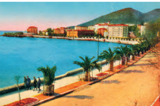
© Ville d'Ajaccio - Palais Fesch