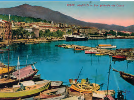
12262, AJACCIO — Vue générale des Quais