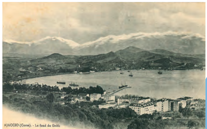
AJACCIO (Corsa). - Le fond du Golfe