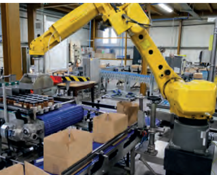
Les locaux de Corsica Gastronomía

Allemagne, en Belgique, aux Pays-Bas, en Norvège, en Suède, en Finlande. Ces pays sont très friands de produits régionaux et de cette authenticité qu'on trouve chez nous.