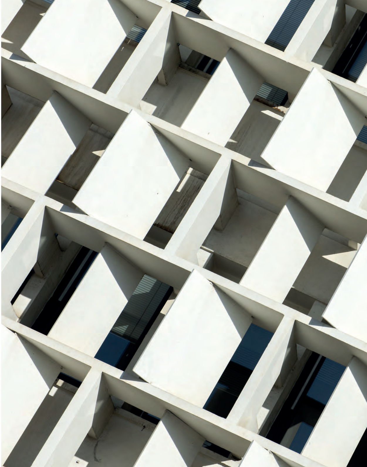
Le siège de la Caisse d'Allocations Familiales (CAF) Ajaccio